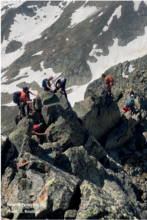
Dent de Fenestral - OJ Photo : S. Rouiller